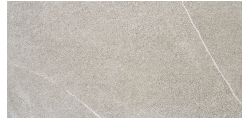
Udine Ceniza 60x120 R