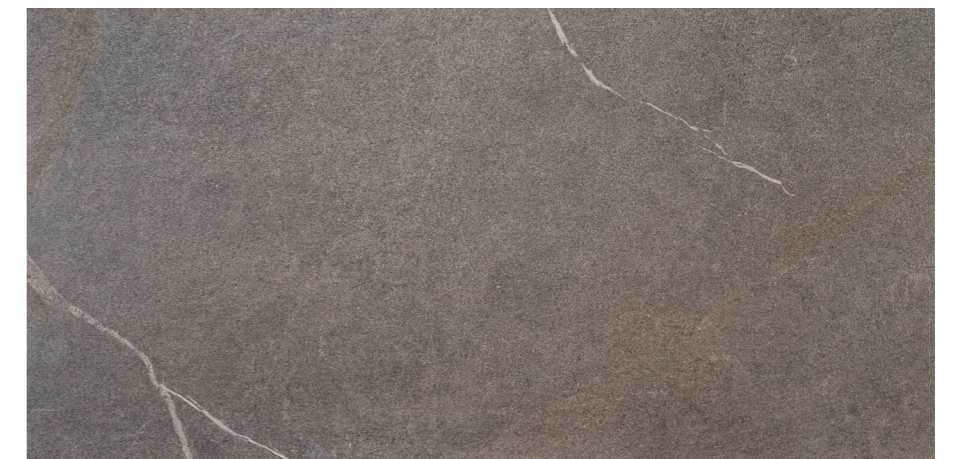
Udine Gris 60x120 R