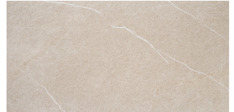
Udine Arena 60x120 R