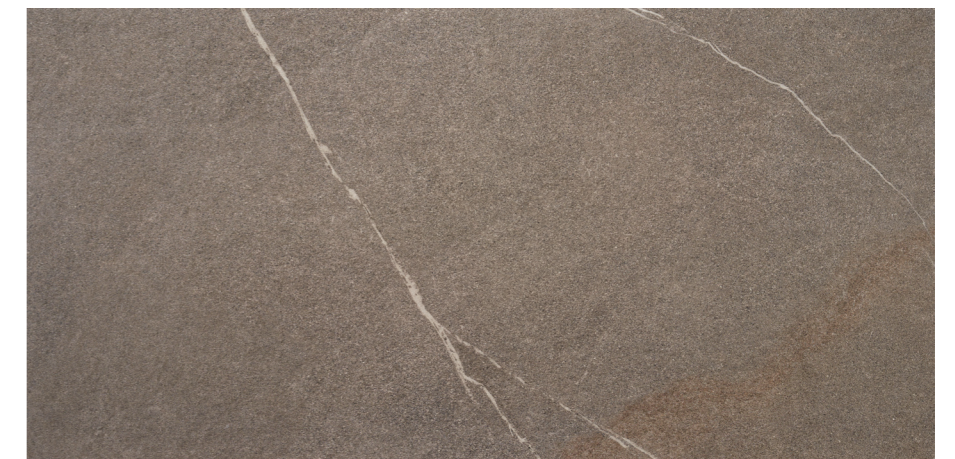
Udine Natural 60x120 R